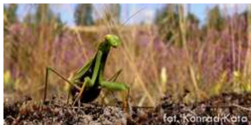
Modliszka zwyczajna – symbol Puszczy Sandomierskiej

W Puszczy Sandomierskiej odnotowano około tysiąca gatunków roślin naczyniowych. Spotykamy również niezwykle bogactwo zwierząt z różnych grup systematycznych w tym bardzo rzadkie i zagrożone w Polsce. Symbolem tego terenu jest modliszka zwyczajna w innych regionach kraju praktycznie nie występująca, tutaj zaś spotykana jest na terenie całej Puszczy Sandomierskiej.